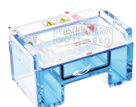
PerfectBlue Gelsystem, Mini