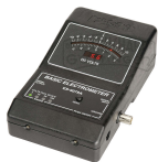
PASCO Elektrometer Bestellnummer 71040238