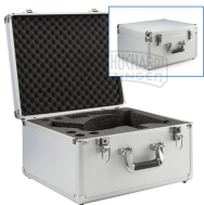
Aluminium Transportkoffer Bestellnummer 421012