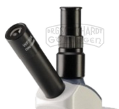
Duokopf mit Okular WF 10fach