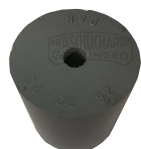
Gummistopfen 27/21mm 1 Loch 5mm