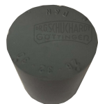
Gummistopfen 27/21mm ohne Loch