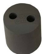
Gummistopfen 27/21mm 2 Löcher 5mm